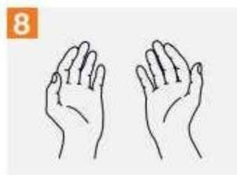
8 Веднъж щом са сухи, ръцете са готови.

2. Премахнете маската, която е била на лицето ви, използвайки ластичите/връзките като внимавате да не я докосвате отвътре.