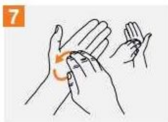
7 Въртеливо разтриване, назад и напред.