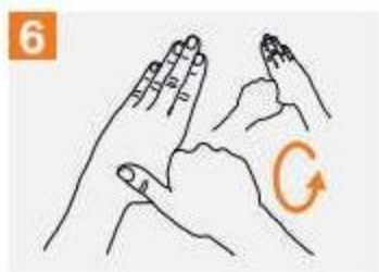
6 Въртеливо разтриване на палеца на лявата ръка прихванат от дясната длан и обратно.