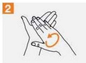
2. Разтрийте ръце си „длан-в-длан“.