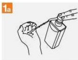
1a. 1b. Нанесете от продукта в дланта си, покривайки цялата повърхност.

1. Извършете щателно измиване на ръцете, съгласно следната схема: