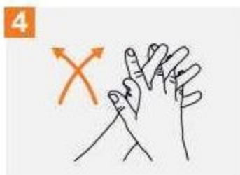
4. Длан в длан със сплетени пръсти.